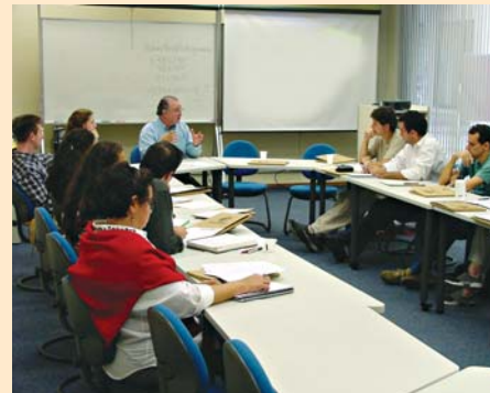
Alunos da primeira turma do MBA Branding, Gestão de Marcas

Mantido pela Fundação de Rotarianos de São Paulo, o ITAE é voltado à pesquisa,