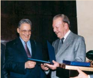
* Fernando Henrique Cardoso em Palestra na sede da Fundação no dia 19/03 (veja na pg. 2)

“... a adesão de todos os povos aos valores universais...”*