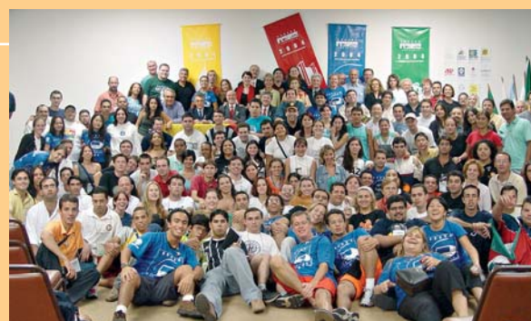
Conarc reuniu jovens de 30 distritos de Rotary, além de Argentina e México, para intercâmbio de informações

A programação foi composta de treinamentos dirigidos; reuniões dos representantes distritais e coordenadores locais