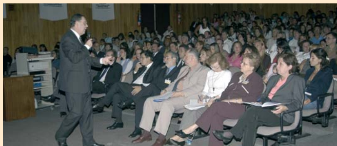
O diretor do Colégio e o corpo docente na abertura do ano pedagógico

Sobre o novo plano estratégico, lembrou: