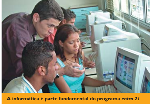
A informática é parte fundamental do programa entra 21

Quatrocentos e oitenta jovens compõem o contingente do programa de 350 horas. O Programa de Capacitação Básica para o Trabalho corresponde a 200 horas e, nas 150 horas restantes, os jovens recebem uma formação complementar direcionada ao desenvolvimento de competências