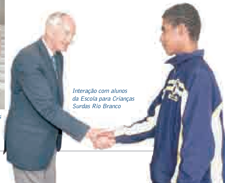
Interação com alunos da Escola para Crianças Surdas Rio Branco