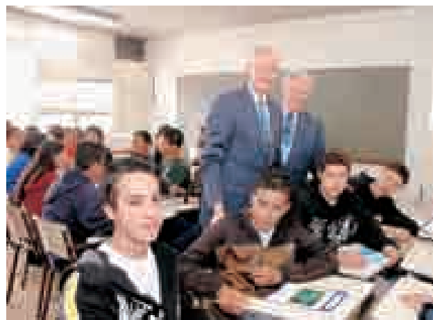
Interação com os alunos do Centro Profissionalizante Rio Branco