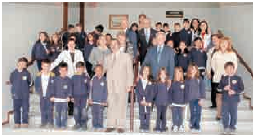
Alunos do coral do Ensino Fundamental I, Granja Vianna