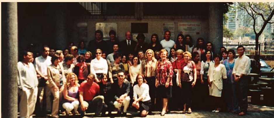
Equipe de professores durante a festa de aniversário da escola