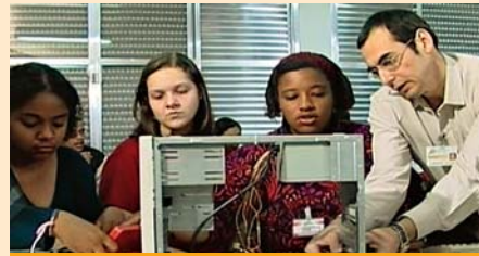
Alunos durante aula no CEPRO

A Fundação de Rotarianos de São Paulo firmou parceria com a International Youth Foundation, com a colaboração do BID-Banco Internacional de Desenvolvimento e