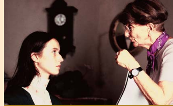
Suzana Amaral na direção do longa “Uma Vida em Segredo”