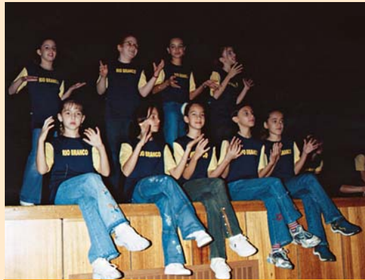
Alunos se expressaram com muita criatividade

Na Unidade Granja Vianna a Mostra, que recebeu o título de “Portinari 100 anos”, teve